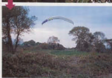
フライトの際はエリア規定を必ず守ることが大切。

ンをアイドリングにしても十分、ちょっとした山飛び気分。というのも、ここ大山は以前パラフライヤーが山飛びエリアとして飛んでいたこともあった場所です。 さて、アスタムランドからランディングまでは、そのまま田んぼの中を突っ切つて帰ると良いでしょう。ですが、残り約1kmのガソリンが心配なら真直ぐ南下して吉野川の河川敷に出て下さい。