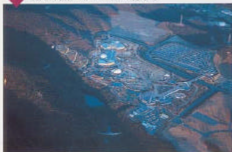
アスタムランドは体験型の総合公園だ。