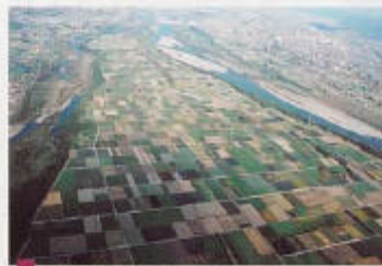
吉野川最大の中州、善入寺島。