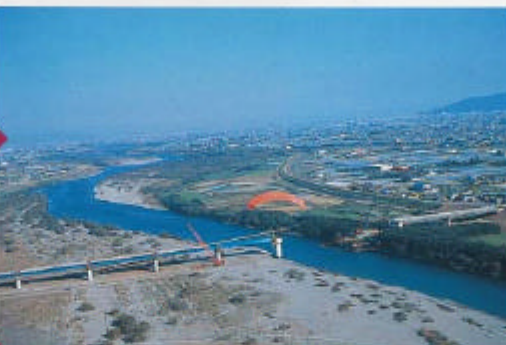
北側ルートと南側ルートの境目となる一条潜水橋。

す。吉野川沿いに飛んで行けるので、レッスンも出発できるでしょう。ただ、片道10回もありランディングからは見えなくなるので無縁は必要です。テイクオフして少し行くと釣り舟が集まったポイントがあります。ここは低く飛ぶと魚が逃げるので、ある程度高度をとって通過するか、川の上は避けて川原の上を飛びましょう。 その先へ行くといくつかの潜水橋と新しく建築中の橋があります(潜水橋とは大水の時に水の中に水没する橋のことです。高知県では沈下橋と言います)。この新しく建築中の橋の下をくぐれるかどうか、みんな挑戦したことがありますが、結果は残念ながら先を越されてしまいました。ここから、川を南側を行くか北側を行くか、フライヤーによってコースが分かれるところ。最初で行くなら北側を飛びコースがよいでしょう。でも、僕は南側に行く場合が多いです。南側を行くと四輪駆動車が水を渡ったり坂を登ったりとモーグルコースになっている場所があり、これを上から眺めるのも楽しいです。