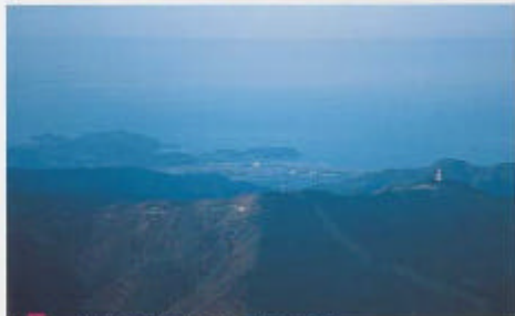
大山は山頂に2本のアンテナが見える。