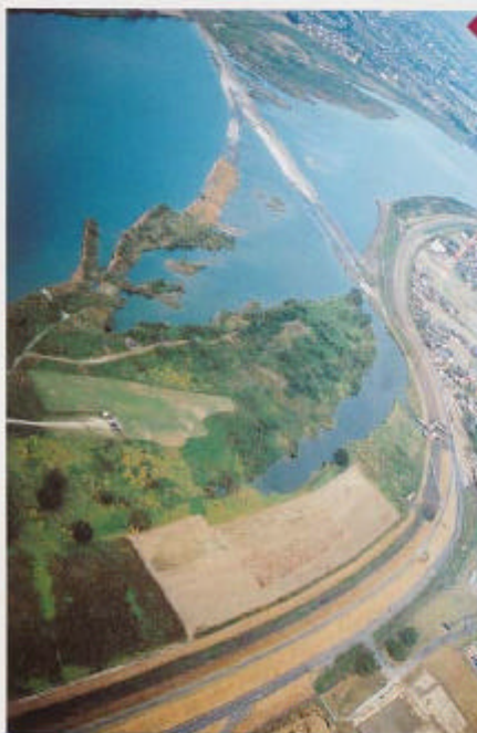
第十堰の北岸には着陸可能なスペースがある。

す。吉野川沿いに飛んで行けるので、レッスンも出発できるでしょう。ただ、片道10回もありランディングからは見えなくなるので無縁は必要です。テイクオフして少し行くと釣り舟が集まったポイントがあります。ここは低く飛ぶと魚が逃げるので、ある程度高度をとって通過するか、川の上は避けて川原の上を飛びましょう。 その先へ行くといくつかの潜水橋と新しく建築中の橋があります(潜水橋とは大水の時に水の中に水没する橋のことです。高知県では沈下橋と言います)。この新しく建築中の橋の下をくぐれるかどうか、みんな挑戦したことがありますが、結果は残念ながら先を越されてしまいました。ここから、川を南側を行くか北側を行くか、フライヤーによってコースが分かれるところ。最初で行くなら北側を飛びコースがよいでしょう。でも、僕は南側に行く場合が多いです。南側を行くと四輪駆動車が水を渡ったり坂を登ったりとモーグルコースになっている場所があり、これを上から眺めるのも楽しいです。