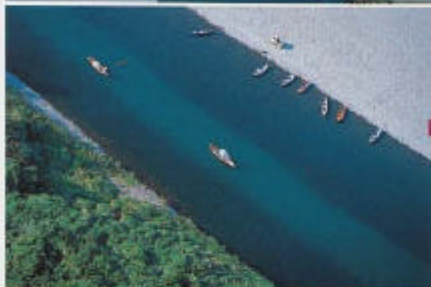
釣り場の上空は高度をとって通過するか川面の上を抜けて飛ぶ。