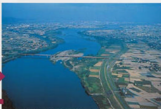
この六条大橋の南側を迂回すると目的地の第十堰。

テイクオフすると、まず川原の上で高度をとります。これは騒音と緊急時のためで、高度500mくらいまで上昇すればスタートです。森林公園は山の向こうで見えないため、地図によるナビゲーションが必要。こちらの方向と照って山を越えたと全然違ってある場合もあります。まあ、ガイドとしては手前の向麻山を目標に飛んでいきます。向麻山は独立しているの、すぐにわかります。山頂には公園と神社があり、中腹はテニスコートと公園になっています。向麻山を過ぎると前方に山並みが見えてきますので、