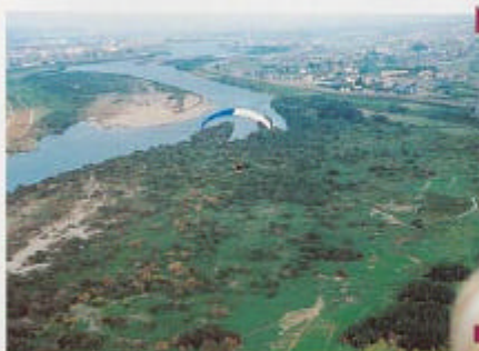
南側を行くと四駆のモーグルコースがある。