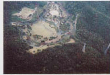
肥料に余裕があれば森林公園を西に向かう。