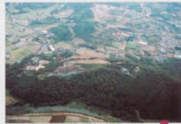
ここ内麻山を越えて前方正面の一帯高い所を目指す。