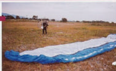
キャンピーを広げるのにも余裕の広さ。