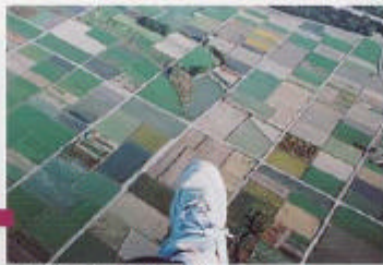
善入寺島には田んぼが広がる。