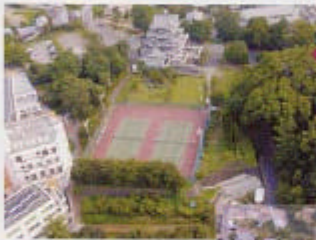
大山山頂から東を見ると、面白そうな建物が並んでいるのが目に入ります。そこがアスタムランドです。ここは体験型の総合公園で、子供科学館やプラネタリウム、体験工房などがあり、家族で楽しむのには良いところ。アスタムランドへは気流を拾いながら行けば、エンジ

サーマルがある場合は積極的に利用したいものです。山頂まで上がると瀬戸内海側が一望できて、天気が良いと絶景が広がります。