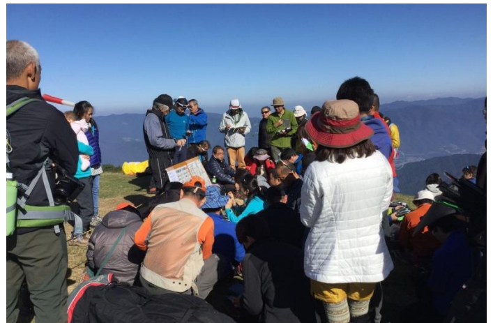
どんなタスクになるのか？