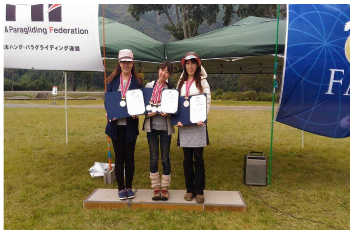
女子スポーツクラス