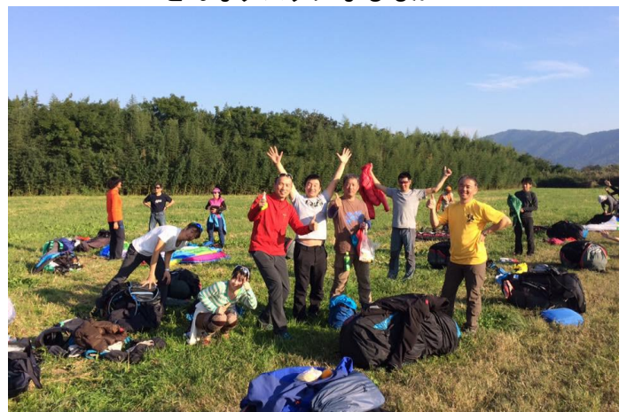
ゴールを決めた選手たち