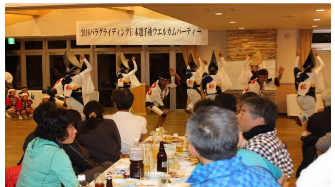
ウエルカムパーティー