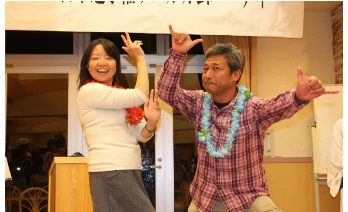
Jリーガーで阿波踊りが上手かった2人