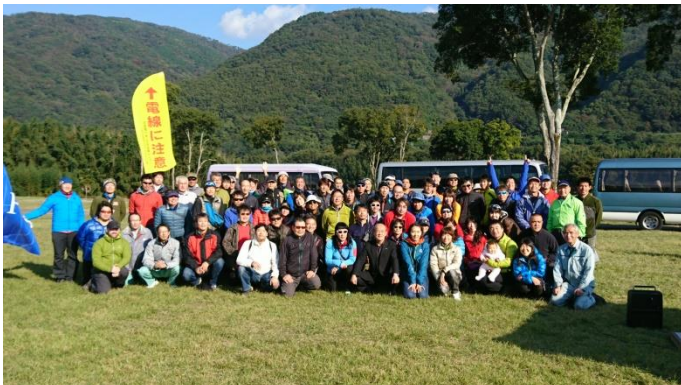
開会式で東みよし町長と

夜にはウエルカムパーティーがひらかれ、阿波踊りや恒例のビンゴゲームが行われ楽しい宴となりました。パーティーは日本選手権と言う事で、いつもより料理もお酒もレベルアップしました。多すぎて余った料理をパック詰めにして持ち帰る選手や、酒瓶を小脇に抱えて帰る人までいて、宿泊所であった東部福祉センターではその後も宴は続いたようです。