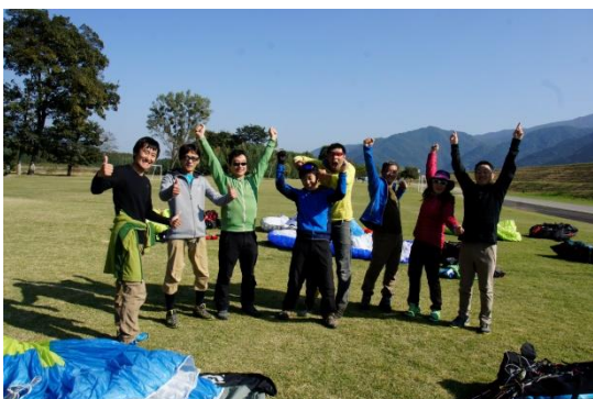
ゴールを決めた選手たち